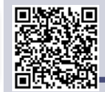
Environnement et développement durable