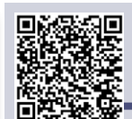
Ministère de la Transition écologique