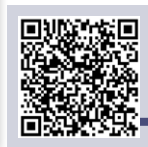
Guide de la biodiversité