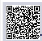
Les missions de la DREAL Nouvelle-Aquitaine

Outre les éléments fournis dans ce vade-mecum, de nombreuses informations en lien avec les politiques publiques portées par la DREAL sont disponibles sur les sites suivants :