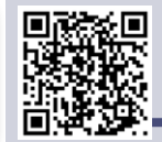
Ministère de la Cohésion des territoires et des Relations avec les collectivités territoriales