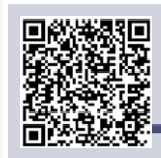
Guide du maire 2020